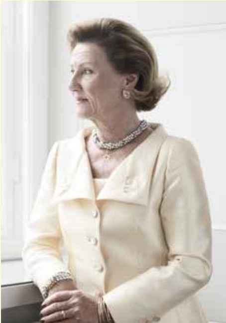
H. M. Dronning Sonja