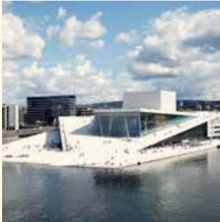
Den Norske Opera & Ballett