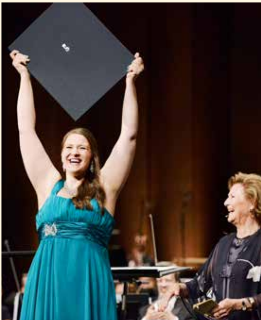
H.M. Dronningen med Lise Davidsen, sopran (Norge), 1. pris 2015